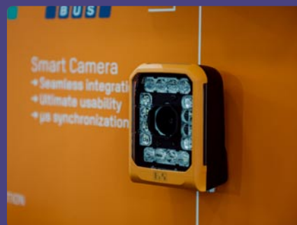
B + R automatizace, spol. s r. o., Nové Mesto n/Váhom (SK)

Vystavovateľ: ABB, s. r. o., Bratislava (SK)