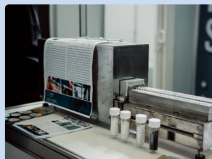
Strojnícka fakulta STU v Bratislave (SK)