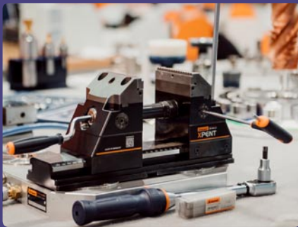
Hoffmann Qualitätswerkzeuge SK, s. r. o., Bratislava (SK)