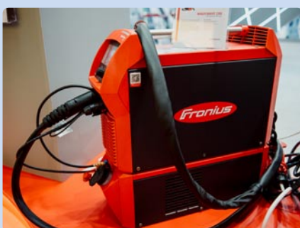
Fronius Slovensko, s. r. o., Trnava (SK)