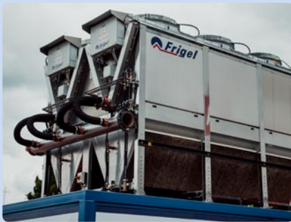
TG - Toman Group, spol. s r. o., Bratislava (SK)