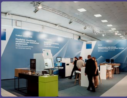
TRUMPF Slovakia, s. r. o., Košice (SK)