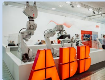
ABB, s. r. o., Bratislava (SK)

Exhibitor: ABB, s. r. o., Bratislava (SK)