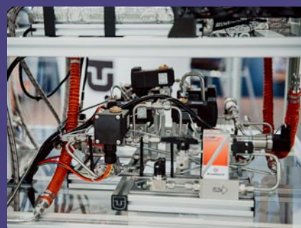
TU v Košiciach, Strojnícka fakulta, Košice

Exhibitor: Hoffmann Qualitätswerkzeuge SK, s. r. o., Bratislava (SK) Manufacturer: Hoffmann Nürnberg GmbH Qualitätswerkzeuge, Nürnberg (DE) Name of the exhibit: Garant Xpent