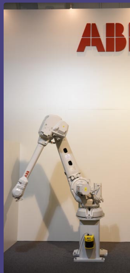
ABB, s. r. o., Bratislava (SK)

Ocenený výrobok: Hydraulický ohraňovací lis HOL 40 Výrobca: JHL – PRODUKT, s. r. o., Trenčín