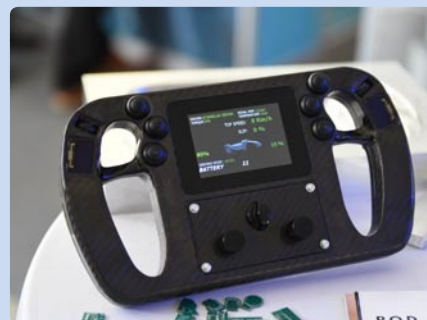
Strojnícka fakulta STU v Bratislave (SK)