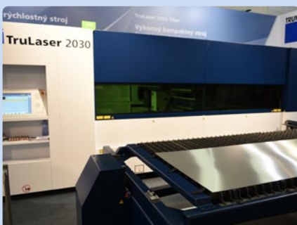
TRUMPF Slovakia, s. r. o., Košice (SK)