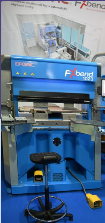
MT - MONT, s. r. o., Bratislava (SK)

Vystavovateľ: Technická univerzita v Košiciach, Strojnícka fakulta (SK) Výrobca: Technická univerzita v Košiciach, Strojnícka fakulta (SK) Názov exponátu: Model vodíkového automobilu využívajúceho pre pohon palivový článok a metalhydridové materiály