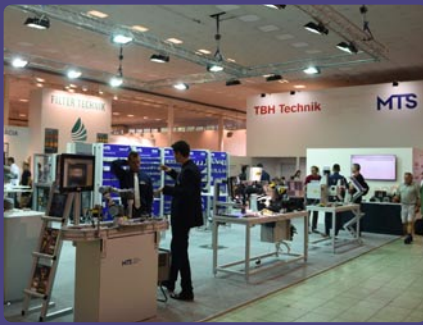
TBH Technik, Žilina a MTS, spol. s r. o., Krivá

Vystavovateľ: ABB, s. r. o., Bratislava (SK) Výrobca: ABB, s. r. o., Bratislava (SK) Názov exponátu: ABB robot IRB 4600 so systémom SafeMove 2 systém pre bezpečnú spoluprácu človeka a robota