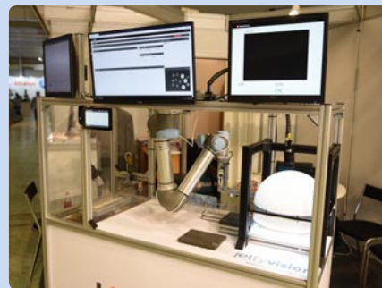
OptiSolutions, s. r. o., Praha (CZ)

Exhibitor: TRUMPF Slovakia, s. r. o., Košice (SK) Manufacturer: TRUMPF Werkzeugmaschinen GmbH + Co. KG, Ditzingen (DE) Name of the exhibit: TruLaser 2030 L82