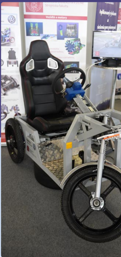
Žilinská univerzita v Žiline, Strojnícka fakulta (SK)

Exhibitor: ABB, s. r. o., Bratislava (SK) Manufacturer: ABB, s. r. o., Bratislava (SK) Name of the exhibit: ABB robot IRB 4600 with SafeMove 2