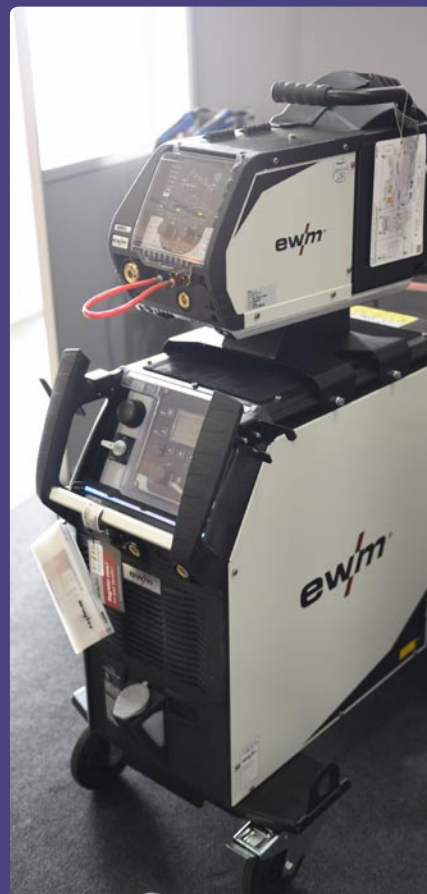
FORMICA, spol. s r. o., Nitra (SK)

Vystavovateľ: TRUMPF Slovakia, s. r. o., Košice (SK) Výrobca: TRUMPF Werkzeugmaschinen GmbH + Co. KG, Ditzingen (DE) Názov exponátu: TruLaser 2030 L82 Laserový rezací stroj