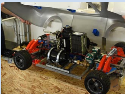
Technická univerzita v Košiciach, Strojnícka fakulta (SK)

Exhibitor: Technická univerzita v Košiciach, Strojnícka fakulta (SK) Manufacturer: Technická univerzita v Košiciach, Strojnícka fakulta (SK) Name of the exhibit: A model of a hydrogen car using a fuel cell and metal hydride materials