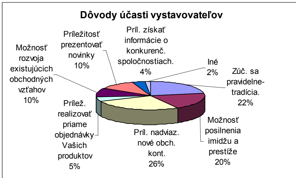
Graf.č.4 Dôvody účasti vystavovateľov v roku 2007

52% zúčastnených vystavujúcich firiem realizovalo na veľtrhu objednávky. Významný podiel našich komunikačných partnerov predstavujú i žurnalisti, ktorých záujem o naše podujatia každoročne narastá. 1505 novinárov, ktorí sa akreditovali na našich podujatiach, predstavuje stabilnú podpornú komunikačnú základňu našich aktivít zameraných na styk s verejnosťou. Každé podujatie je zhodnotené samostatnou záverečnou správou, ktorá obsahuje základné informácie o profile výstavy, produktoch a produktových skupinách a hlavných zákazníckych skupín, ktoré sa zisťujú na základe analýzy existujúcich podkladov a pomocou metód kvalitatívneho a kvantitatívneho marketingového výskumu.