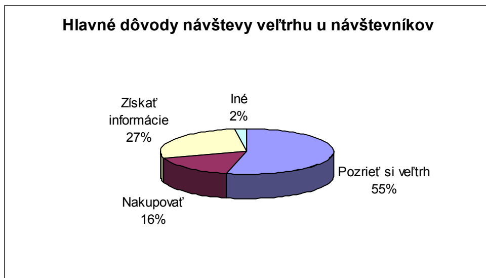
Graf č.2 Dôvody účasti návštevníkov veľtrhu

Dôvody účasti návštevníkov boli predovšetkým informácie, nasledoval záujem o nákup, vid'. graf č.2.