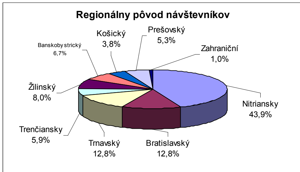
Graf č.1 Regionálna štruktúra návštevníkov veľtrhu

Dôvody účasti návštevníkov boli predovšetkým informácie, nasledoval záujem o nákup, vid'. graf č.2.